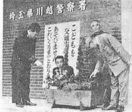
川越市植木花開園芸組合(組)し、川越市合原原野氏では、三月に行...