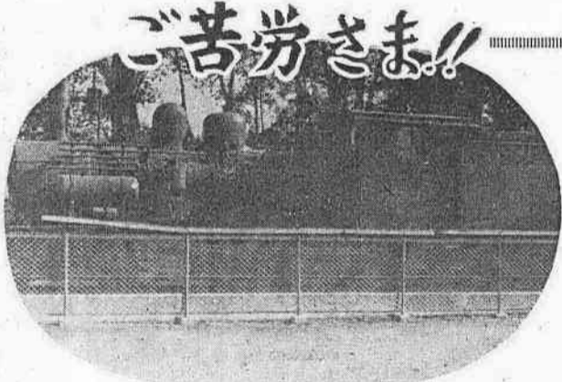
68年間も走ってゆっくりに休む機関車