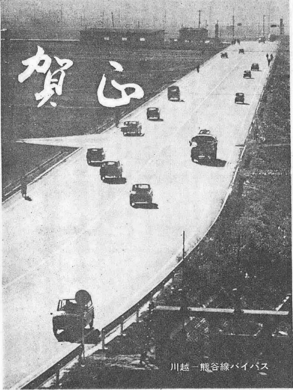
川越-熊谷線バイパス

市民の皆さま、新年お目出とうございます。 過去二年有余に亘る川越市政の主な成果は 一、市議会との前向きな協力強化により、市政の運営推進がとみに明かかつ活発化したこと。 二、一時は二億円を越える赤字を繰越された市一般会計も、一応バランスのとれた段階にまで改善を見たこと。 三、市民待望の南東バイパスの建設も、停頓していた用地買収が進展、本年からはいよいよ工事開始されること。 四、位置問題で建設が停滞された市民体育館も、所定の時期までに竣工し、団体リハサルも大成功に終わったこと。 五、市内の水処理所化を阻んだ下水処理場用地買収問題も急進に解決し、本年竣工の上は、旧市内大平の水処理所化が可能となること。 六、難事業であった等備上江橋線改良工事も、三光町を最後に漸く開通し、その先の東武及び国鉄上を立体交差する架橋が完成した。 七、難事業であった等備上江橋線改良工事も、三光町を最後に漸く開通し、その先の東武及び国鉄上を立体交差する架橋が完成した。 八、難事業であった等備上江橋線改良工事も、三光町を最後に漸く開通し、その先の東武及び国鉄上を立体交差する架橋が完成した。 九、難事業であった等備上江橋線改良工事も、三光町を最後に漸く開通し、その先の東武及び国鉄上を立体交差する架橋が完成した。 十、難事業であった等備上江橋線改良工事も、三光町を最後に漸く開通し、その先の東武及び国鉄上を立体交差する架橋が完成した。 十一、難事業であった等備上江橋線改良工事も、三光町を最後に漸く開通し、その先の東武及び国鉄上を立体交差する架橋が完成した。 十二、難事業であった等備上江橋線改良工事も、三光町を最後に漸く開通し、その先の東武及び国鉄上を立体交差する架橋が完成した。 十三、難事業であった等備上江橋線改良工事も、三光町を最後に漸く開通し、その先の東武及び国鉄上を立体交差する架橋が完成した。 十四、難事業であった等備上江橋線改良工事も、三光町を最後に漸く開通し、その先の東武及び国鉄上を立体交差する架橋が完成した。