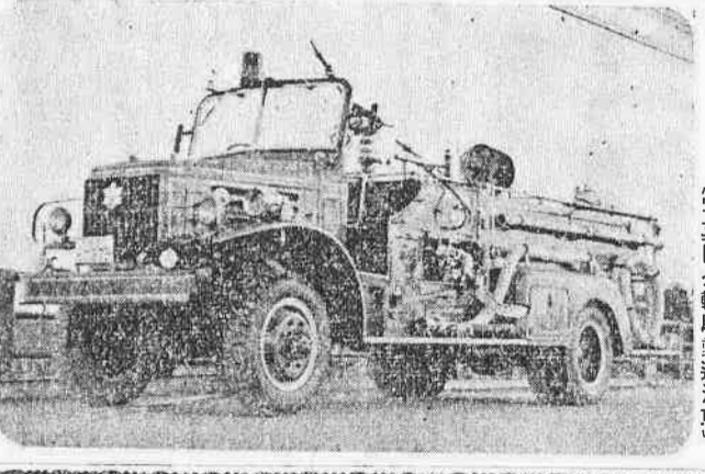
写真は全輪駆動速消車

みなさんは「速消車」なんて、少しも珍しくないや—といわれるでしょう。だがちよつと待つて下さい。ボクのような近代的な設備と強い体を持つた消防ポンプ自動車でしかも全輪が自由に駆動できるのはまだ全国に数台きりありません。ボクの生れは東京都品川区大井町の「いすゞ自動車大井工場」です。そして現住所の川越市に正式に入籍したのは昭和三十三年十二月五日です。ボクの性能は…… 機関部…いすゞガソリンエンジン6気筒 出力…130馬力 放水時間約…10分 放水圧…200立 積載水量…2,500立 となつていますから、油火災や危険物取扱工場などの火災にも偉力を発揮できます。川越市消防署に配置され、先陣諸君と待機しています。ボクのお願ひ……そこでボクのお願ひは、全長四米におよぶボクの体で火災現場に向う時は、どうかボクや仲間たちに道をあけてくださること、そして何よりもご家庭で火の元に注意して、大切な財産を守り、ものぐさいボクをあまり引張り出さないで下さい。お願ひします。