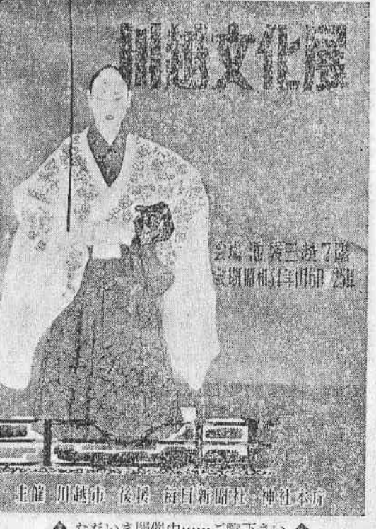
主催 川越市 後援 毎日新聞社 神社本庁