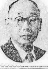
筆者略歴 昭和二三年川越市選挙管理委員長に就任、二七年再任委員長に

四月二十三日、市議会議員と市長の選挙が四月三十日に、また六月の下旬には参議院議員の半数改選の選挙がそれぞれ行われる予定です。四月から六月の三ヶ月の間に都合四つの選挙を経験する訳です。 これは大変なことといわなければなりません。選挙が接近してその煩雑さに対する負担も増してくるから、それによつてこの二カ月の間に政治の本質(特に今年に地方行政の本質)をなさんとともに願いたい気持です。 さて、ことしは選挙の年です。選挙の年では「あなたの一選」は事ある身近な選挙であるだけに、いたづらに選挙の