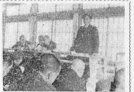
◇みんなてわになつて◇ 公明選挙「話しあいの会」を