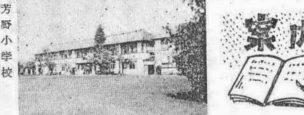
芳野中学校 芳野小学校