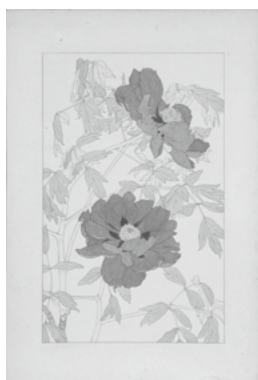
杉浦非水《牡丹(『非水百花譜』原画)》1918年