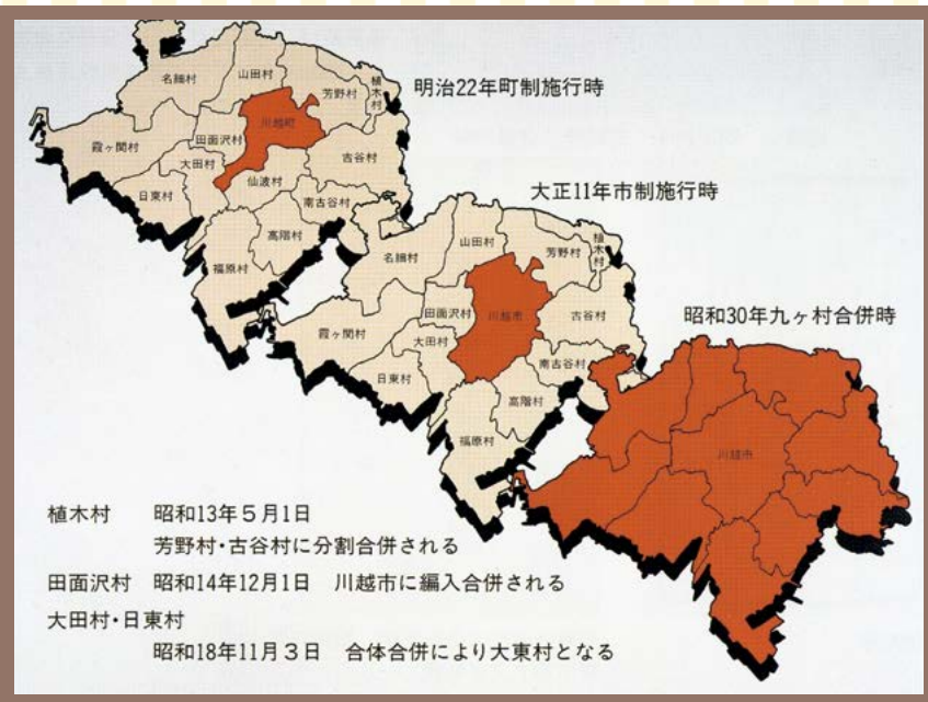
市域の変遷(市立博物館常設展示図録)

明治22年 町制が施行され川越町が誕生 大正11年 仙波村を合併し市制施行 昭和14年 田面沢村を合併 昭和30年 周辺9村と合併し、 現在の川越市域となる