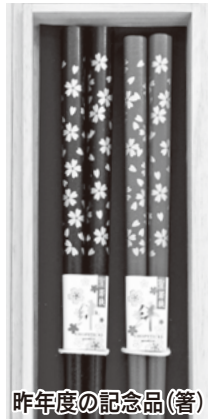
昨年度の記念品(着)

申し込み…同課(本庁舎3階)・市民センター・川越駅西口連絡所で配布する申請用紙に必要事項を記入し、6月30日(木)までに郵送または直接配布場所