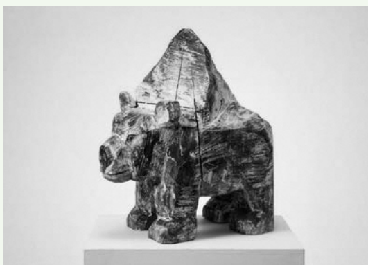
ヒグマッターホルン 2019年 © 柳場大(やなぎばまさる)