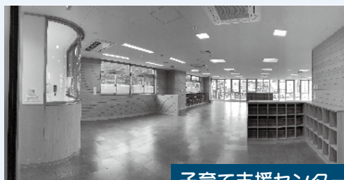
子育て支援センター