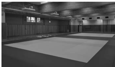
新しくなった柔道場

耐震補強工事と道場、トイレ、 空調設備等の改修工事を行い、よ り快適で利用しやすい施設になり ました。また、オープンにあわせ、 使用料を改定します。