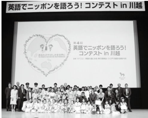
昨年7月 英語のスピーチコンテスト