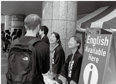
昨年10月 川越まつりでの英語観光ボランティア