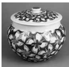
富本憲吉「色絵金銀彩四弁花文飾壺」1960年

日時…5月25日(土)午前10時～正午 対象…小学生以下(未就学児は保護者同伴) 定員…20人(抽選) 経費…200円 申し込み…5月8日(火)までに電話・ファクスで同館