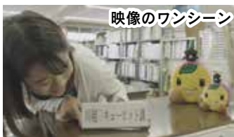
映像のワンシーン

申し込み…3月15日(日)午前9時から電話で農業ふれあいセンター☎226-6551(市ホームページからも可)