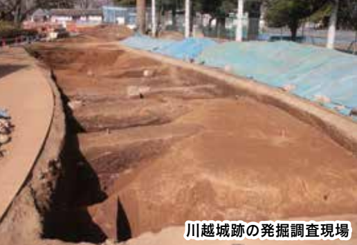
川越城跡の発掘調査現場

また、一部の堀の壁面には、土を少しずつたたき強固な地盤を造る工事である「版築」が、丁寧に施されていることが確認できました。