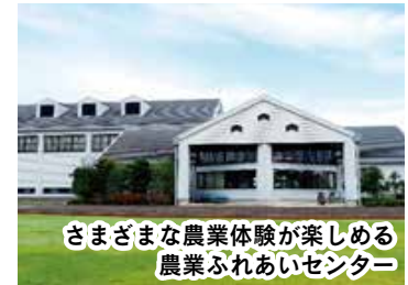
さまざまな農業体験が楽しめる農業ふれあいセンター

3月20日(祝)には、同センター北側に県内最大規模である500区画ほどの市民農園がオープンする予定です。趣味・食育・健康などの視点からも皆さんの生活の中に「農」を取り入れてみませんか。