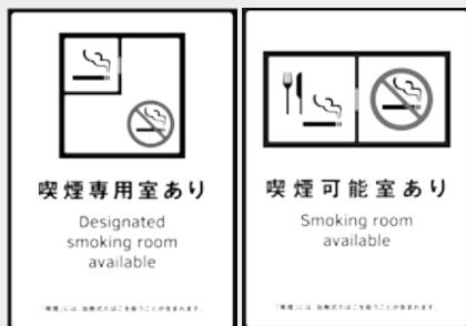
出入口口に設置される標識の例

*喫煙エリアには、保護者の了解が得られたとしても、20歳未満を立ち入らせることはできません。喫煙エリアに立ち入らせた場合、施設の管理者等に罰則が科せられることがあります。 *20歳未満を連れて飲食店等を利用する場合は、出入口にある標識を確認してから利用するようにしましょう。