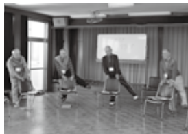
いすを使い、片足を真横に上げるいもっこ体操