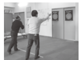
ダーツ先端がマグネットになっています