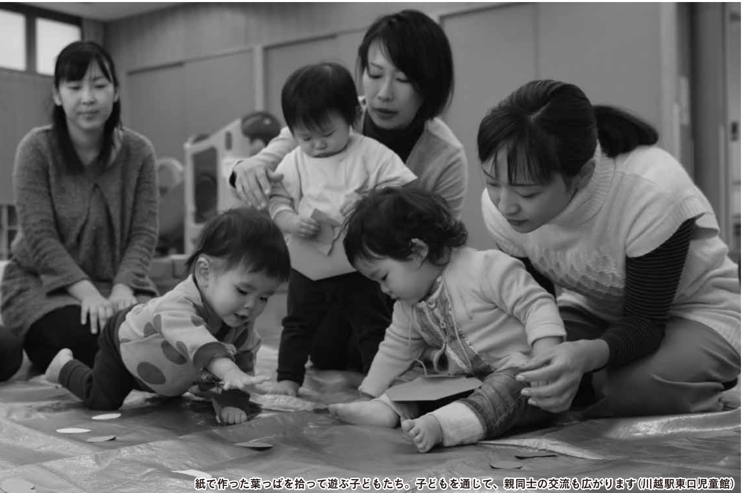
紙で作った葉っぱを拾って遊ぶ子どもたち。子どもを通じて、親同士の交流も広がります(川越駅東口児童館)