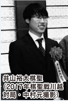
井山裕太棋聖 (2017年棋聖戦川越 対局)

囲碁の第44期棋聖戦第2局が来年1月20日(月)・21日(火)に蓮馨寺で開催され、井山裕太棋聖が挑戦者と対局します。この対局に併せ、次のとおり関連イベントを開催します。囲碁棋聖戦川越対局実行委員会主催。