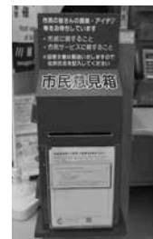
本庁舎1階にある市民意見箱

設置場所は、市民センターや公民館など次の26か所です。寄せられたご意見は、市長が直接拝読します。