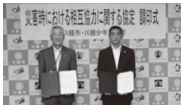
協定書を手を持つ川越少年刑務所の柴田所長(右)と川合市長