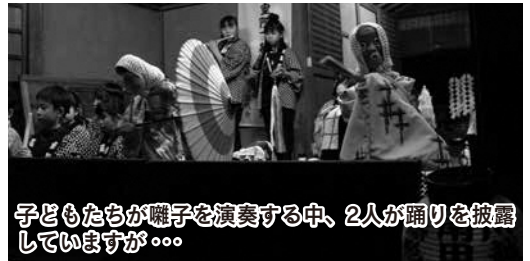
子どもたちが囃子を演奏する中、2人が踊りを披露していますが...