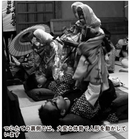
ついたての裏側では、大変な体勢で人形を動かしています