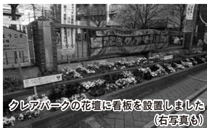
クレアパークの花壇に看板を設置しました (右写真も)

また、市では、東京2020大会に向けて、川越市を訪れた方をたくさんのお花が迎える、おもてなしを推進しています。市民の皆さんも庭などに花や緑を増やしてみませんか? オリンピックに向けて市内の機運を盛り上げていきましょう!