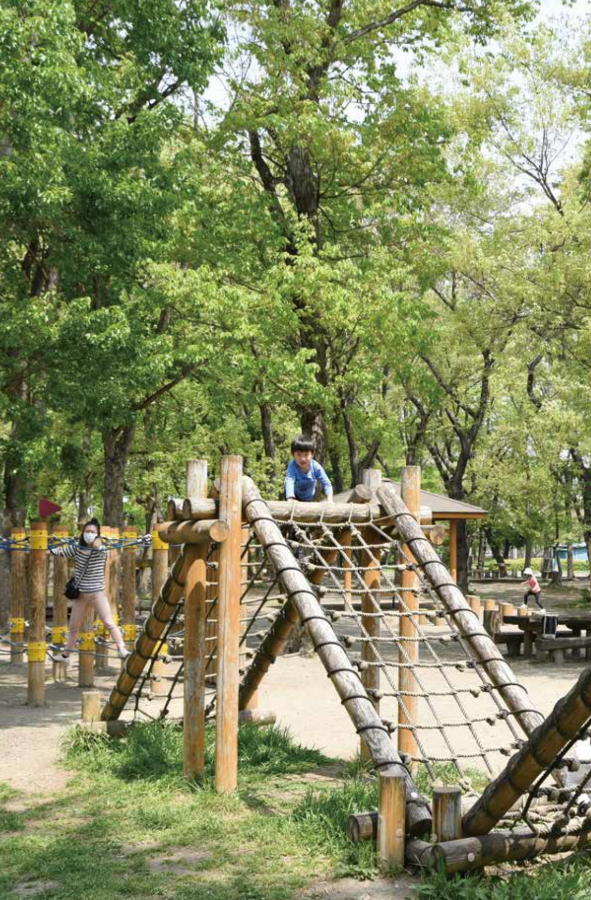
新緑の伊佐沼公園