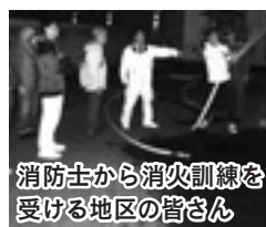
消防士から消火訓練を受ける地区の皆さん

11月13日には、同地区内の自治会や商店街の皆さんが、川越まつり会館駐車場で消火訓練を開催しました。当日は、消防士による消火器の取り扱い訓練や火災予防に関する講話、簡易型屋外消火栓の操作説明などが行われました。いざというときに地区を火災等から守るため、日常的な操作訓練が大切です。この地区は自主的な防災活動により、守られています。