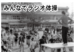
みんなでラジオ体操

新宿町一丁目から新宿町六丁目までの区域で活動しています。地域内のさまざまな課題について部会ごとに話し合い、情報交換会において対応策を検討するなど、課題解決に向け一歩一歩進めています。取り組みとしては、地域で実施する「新宿フェスタ」と連携して、ラジオ体操を通じた健康増進事業、避難訓練事業を毎年実施しています。