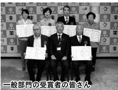
一般部門の受賞者の皆さん

今年度のテーマは「健診」「運動」「食事」「健康寿命」。一般部門・小学生部門の2部門に計237作品の応募があり、その中から楽しく、健康意識の向上につながる作品として、最優秀賞各部門1作品、優秀賞各部門6作品の合計14作品が選出されました。11月19日には、市長から受賞された方へ、ときも健康川柳の表彰状を授与しました。選出された作品は今後、広報川越で紹介していきます。また、川越市国民健康保険で40歳から74歳までの加入者を対象に実施している、特定健康診査を周知するためのポスター、チラシ、封筒やパンフレットなどにも掲載する予定です。