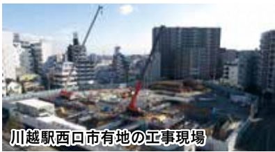
川越駅西口市有地の工事現場

川越駅西口の市有地活用事業につきましては、2020年の供用開始に向けて、官民連携による拠点施設の整備が着実に進む中、歩行者用デッキを市有地まで延伸する工事にも本格的に着手いたします。川越駅東口におきましては、駅前広場