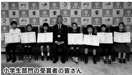
小学生部門の受賞者の皆さん

市民の皆さんに、健康について考え、健康づくりや健診を身近に感じていただくために、ときも健康川柳を募集しました。