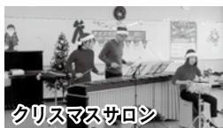
クリスマスサロン

川鶴地域まちづくり基本計画を策定し、「この地に住むあらゆる人たちが、豊かな自然を大切にしながら常に共助の精神で助け合い、健康で安心して住めるコミュニティあふれる川鶴の街を創造する」を目標に、地域交流サロンを定期的に催すなど、毎年、さまざまな活動を実施しています。今年度は、地域安全マップを作成し、今後の地域活動に活用していきます。