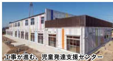
工事が進む、児童発達支援センター

支援センター」として、新たにオープンいたします。新施設におきましては、相談体制についても充実を図り、発育や発達に心配のある児童や保護者へのきめ細かな支援を行ってまいります。