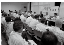
地域会議の皆さんがタウンミーティングで意見を出しました

地域コミュニティの充実を図るとともに、地域の課題について話し合っています。地域のコミュニティ活動の拠点となる市民センターが老朽化していることについて、部会を設置し話し合い、陳情書の提出を行いました。今後は、高齢者福祉への地域での取り組み課題などについて、福祉部会で検討していく予定です。