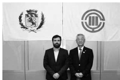
ショーヴェ市長(左)と川合市長

10月4日から7日まで、姉妹都市のフランス共和国オータン市から助役など4人が本市を訪問。滞在中は市内施設の視察や、