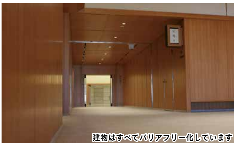
建物はすべてバリアフリー化しています

さらに、建物の高さを抑え、庭園や周囲を緑化することで周りの景観を損なわないように配慮しています。