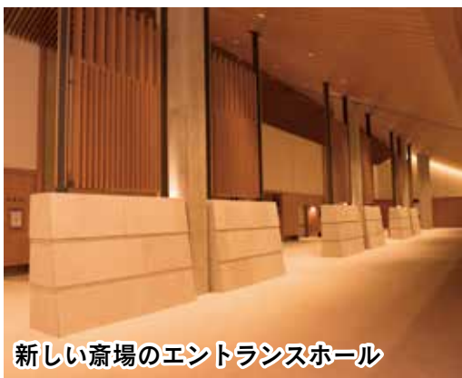
新しい斎場のエントランスホール