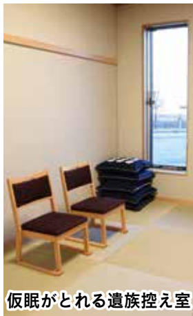
仮眠がとれる遺族控え室

ペット火葬の需要が増加していることから、小動物炉を1炉設置し、1体ごとに火葬を行えるようになります。また、小動物葬斎場を利用する方専用の駐車場や入口を設け、告別室・待合室も設置しています。