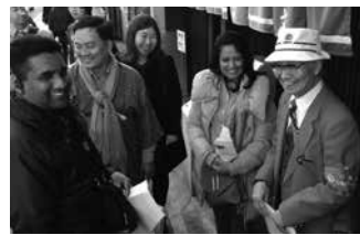
シルバー人材センターの「シルバーガイド」の活動状況を視察