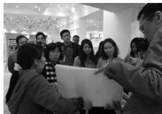
施設職員の話に熱心に聞く研修生

今回、JICA(独立行政法人国際協力機構)主催の「アジア地域における高齢化への政策強化研修」の一環として、12月1日・2日にカンボジアほか5か国、11人の行政官等が視察研修に訪れました。介護予防や高齢者就労の取り組み状況を学んだり、特別養護老人ホーム真寿園等の施設見学を行ったりする中で、高齢者がいきいきと安心して暮らすまちづくりについて活発な意見交換が行われました。