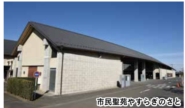
市民聖苑やすらぎのさと