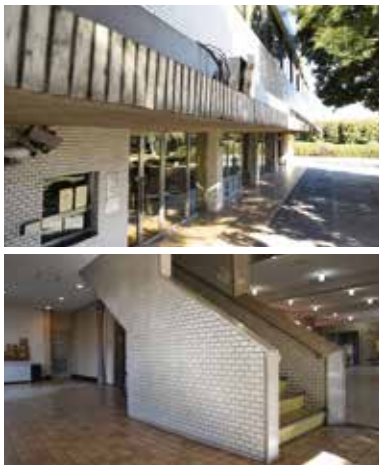
老朽化が進む現在の斎場 上：外観 下：入り口付近と収骨室(左側)

また、高齢化の進行などにより火葬件数が増加し火葬待ちが発生する等、五つの火葬炉では処理能