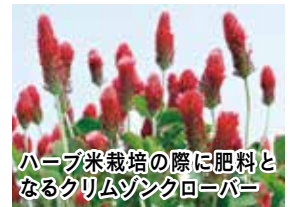
ハーブ米栽培の際に肥料となるクリムゾンクローバー

米、サツマイモ、イチジク、巨峰、クリ、ナス、キュウリ、オクラ、長ネギ、タマネギ、コマツナ