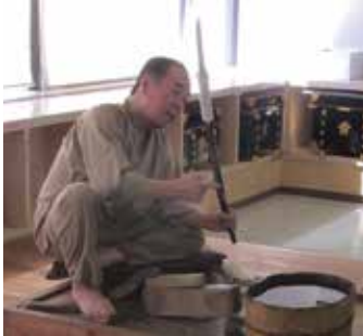
刀剣研磨の実演の様子(昨年)

会期中は作刀および外装に関わるさまざまな職人たちの実演や、なかなか見ることのできない記録映画の上映を行っています。本展覧会は、こうした刀職者たちの伝統技術に触れることができる貴重な機会です。ご来館をお待ちしています。