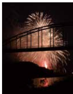
安比奈親水公園の東に架かる入間川水管橋越しに撮影

報川越では、8月25日号から紙面の一部にユニバーサルデザインフォント(すべての人が読みやすい書体)の使用を始めました。新しいフォントはいかががでしょうか。引き続きより良い広報紙になるよう紙面づくりに取り組んでいきます。