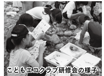
こどもエコクラブ研修会の様子

環境保全を進めていく地域づくり・人づくりのため、環境教育・環境学習の推進、環境活動団体等への支援などを行います。