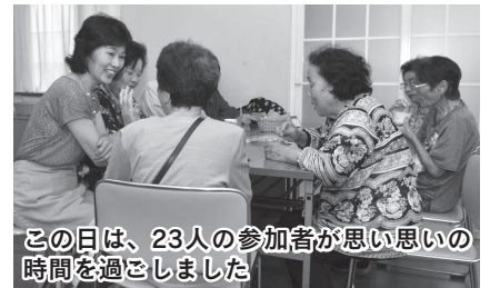
この日は、23人の参加者が思い思いの時間を過ごしました

症を患ってなかなか外出できない方やその家族、地域の方にも利用してもらいたいです。利用者にとつて居心地のよい場所を提供していきたいです」と話します。