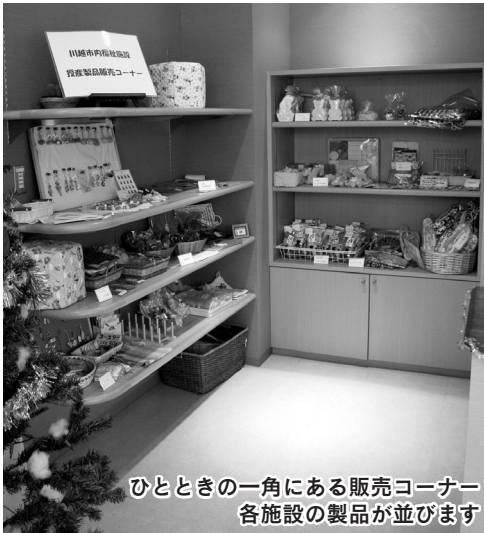
ひとときの一角にある販売コーナー 各施設の製品が並びます