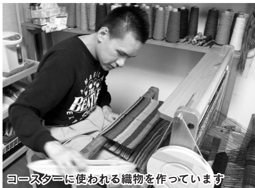
コースターに使われる織物を作っています