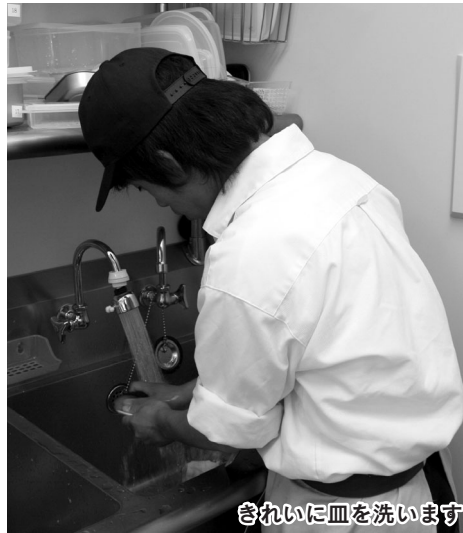
きれいに皿を洗います