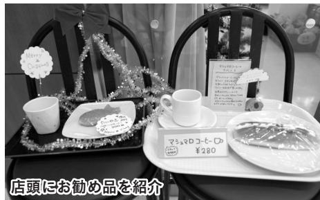
店頭にお勧め品を紹介