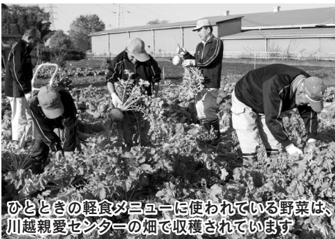
ひとときの軽食メニューに使われている野菜は、 川越親愛センターの畑で収穫されています