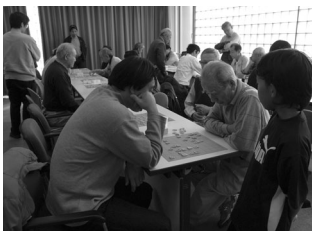
2日、日本将棋連盟川越支部による将棋大会（左）。3日、川越囲碁将棋同好会による囲碁大会（右）。やまぶき会館会議室で、熱戦が繰り広げられました