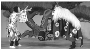
3日に行われた「祭りの響き」。観客の皆さんは、子ども囃子や川越祭囃子保存会による江戸囃子などを楽しみました

昭和二十四年三月十二日、川越市文化団体連絡協議会として発足した、川越市文化団体連合会。現在四十一団体が加入し、会員数は約六千人です。十一月二日・三日、同連合会の創立六十周年を記念し、「文化の香り高いまち・川越」と題して、市民会館でさまざまな催しが行われました。二日間の文化の祭典から、市民会館大ホールの様子をご紹介します。