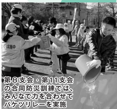
第8支会・第11支会の合同防災訓練では、みんなで力を合わせてバケツリレーを実施