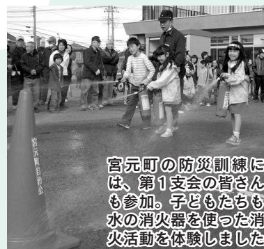
宮元町の防災訓練には、第1支会の皆さんも参加。子どもたちも水の消火器を使った消火活動を体験しました

11月22日に城南中学校校庭で市自治会連合会第8支会・第11支会合同防災訓練が、11月23日に児童相談所中庭で宮元町自治会自主防災会の防災訓練が行われました。自主防災組織を持つ皆さんが、「みんなのまちは、みんなで守る」ために実施。この活動が市内全域に広がり、いざという時に役立つといいですね。