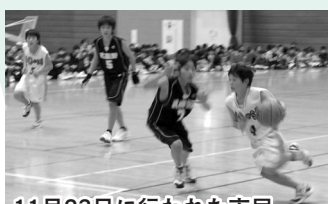
11月23日に行われた市民体育祭でも、両チームが対戦

優勝を果たした、南古谷アクロスと武蔵野ミニバス。11月9日に行われた代表決定戦で、県代表2チームの座を市内の両チームが獲得しました。南古谷アクロスは組織力、武蔵野ミニバスは攻撃力が自慢。市内で互いに競い合って強くなった両チームは、1月に行われる関東大会でも上位を目指します。