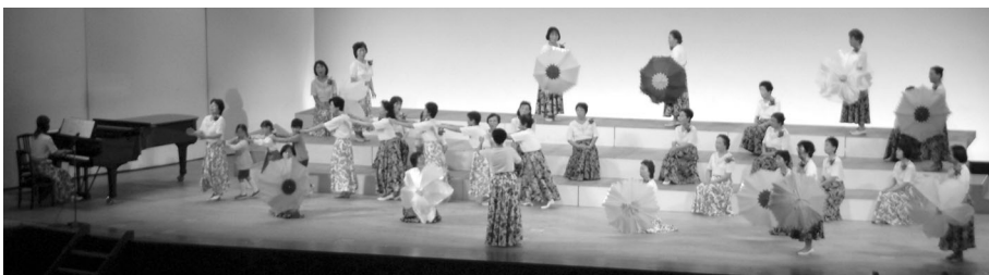
3日に行われた「童謡・唱歌コンサート」。童謡・唱歌普及推進連盟の皆さんの合唱や演奏は、踊りなど楽しい演出が盛りだくさん