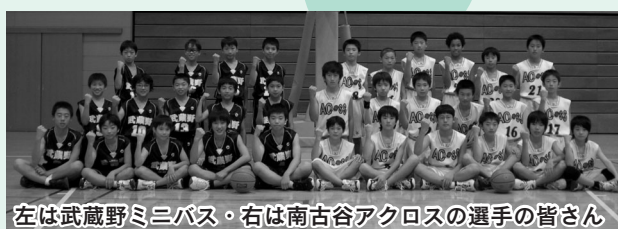
左は武蔵野ミニバス・右は南古谷アクロスの選手の皆さん

優勝を果たした、南古谷アクロスと武蔵野ミニバス。11月9日に行われた代表決定戦で、県代表2チームの座を市内の両チームが獲得しました。南古谷アクロスは組織力、武蔵野ミニバスは攻撃力が自慢。市内で互いに競い合って強くなった両チームは、1月に行われる関東大会でも上位を目指します。