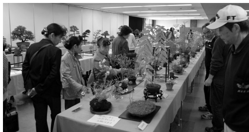
市民会館会議室などで両日行われた合同展示会。川越華道連盟・川越茶華道協会華道部・川越古流協会・初雁盆栽会・日本盆栽会川越支部・日本阜月協会川越支部・小品盆栽倶楽部・川越水石会・川越菊花会・川越山草会の皆さんの作品を展示

川越市民踊連盟・川越市民踊レクリエーション連盟・みよし会・藤の会・川越尺八研究会・津軽三味線真敏会・川越市芸能愛好会・西部吟詠連合会・川越市舞踊連盟・川越シネクラブ・川越茶華道協会茶道部・川越茶友会・川越市俳句連盟・初雁川柳会・川越短歌連盟・路俳句会