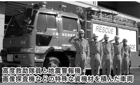
高度救助隊員と地震警報機・画像探査機などの特殊な資機材を積んだ車両

市の中心部に位置する同署は、平成十七年四月に、新宿分署から現在の名称に変更されました。川越駅に近く、周辺の人口密度が高いため、市内八か所の消防署・分署の中で、火災や救急の出動件数が最も多くなっています。