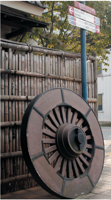
観光サインの下に車輪があります