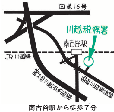
南古谷駅から徒歩7分