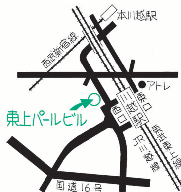
川越駅西口から徒歩1分