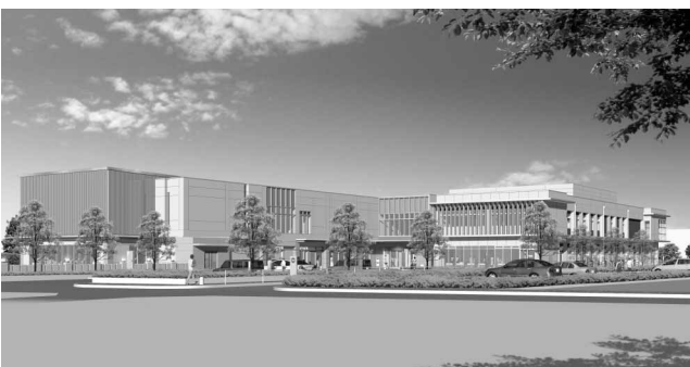
(仮称) 高階地区公共施設完成予想図

しい施設はバリアフリーに配慮され、駐車場も大きくなり、利便性が向上します。また、児童青少年施設や図書館の機能が新たに加わって、同地区に住む皆さんの身近な所で利用できるようになります。 今後は、同地区の自治会活動や生涯学習に関する活動などが、ますます盛んになることが期待されます。 問い合わせ：高階地区公共施設整備推進室高階地区公共施設整備推進担当・TEL内線2871