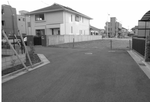
住宅地区内は通過車両が入りにくいよう、道路を設計してあります

第一工区の九・九五ヘクターと合わせ、十六・一五ヘクターの整備を行いました。第二工区の完了に伴い、幹線道路として都市計画道路・川越駅南大塚線を整備。駅前から続く幅員二十五メートルの道路が、国道16号までつながりました。幹線道路から入った住宅地区の道路は、幅員六メートル。通過車両が入って来ないような形状にしています。一方で住宅地区から幹