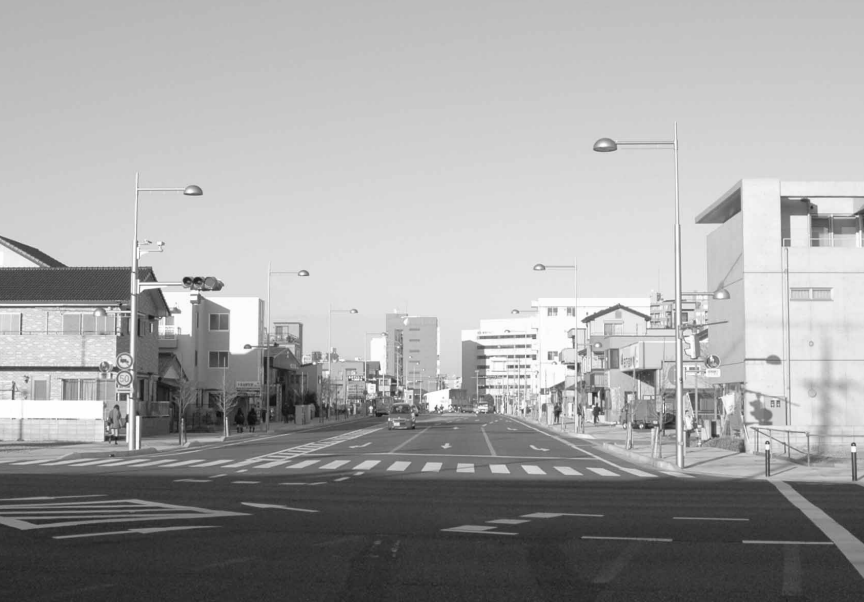
国道16号と川越駅南大塚線の交差点。駅方面からの車線は、方向別に3つに分かれます。歩道が広く、電線も地中化され、すっきりとした幹線道路沿いにおける、これからのまちづくりが楽しみです