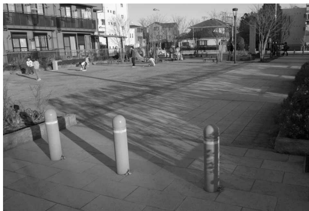
第2工区内の、街区公園と歩行者専用道路