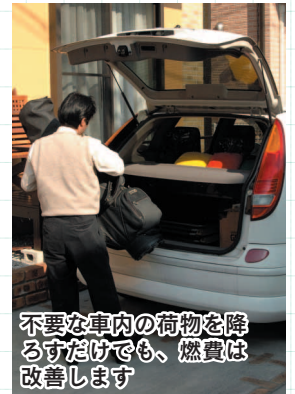
不要な車内の荷物を降ろすだけでも、燃費は改善します