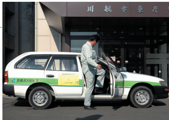
市では天然ガス自動車を使用しています