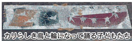
カリらしき鳥と輪になって踊る子どもたち