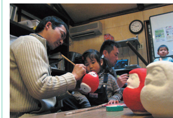
川越だるま絵付け体験の様子 (1月15日)

川越の伝統産業を守る人々 数多くの文化財が、今なお残っている川越。伝統的な産業を活性化することで、さらに観光客増加を目指した取り組みが始まっています。一月に行われた催しの様子と、今後行われる事業について紹介します。