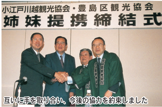
互いに手を取り合い、今後の協力を約束しました

12月4日、(社)小江戸川越観光協会は豊島区観光協会と観光交流を推進していくことで合意しました。