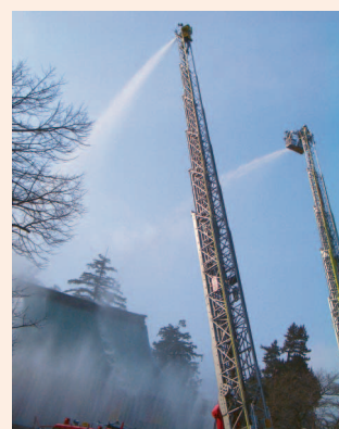
昨年の防火訓練(喜多院)

日時…1月25日(水)、午後1時30分～ 場所…喜多院・仙波東照宮・日枝神社 問い合わせ…文化財保護課管理係・TEL内線2861