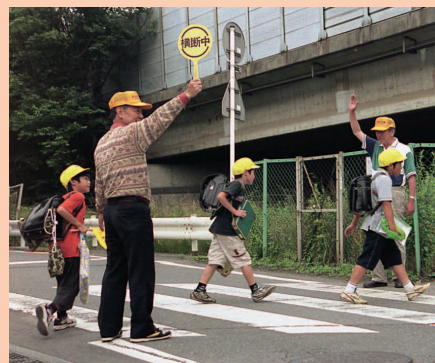
「自分たちの地域は自分たちで守る」を合言葉に、自主防犯活動が盛んになってきました

地域住民の皆様が文化活動やふれあい・交流の場となる新しいコミュニティ拠点として、東部および大東地区に地域ふれあいセンターの整備を推進してまいります。