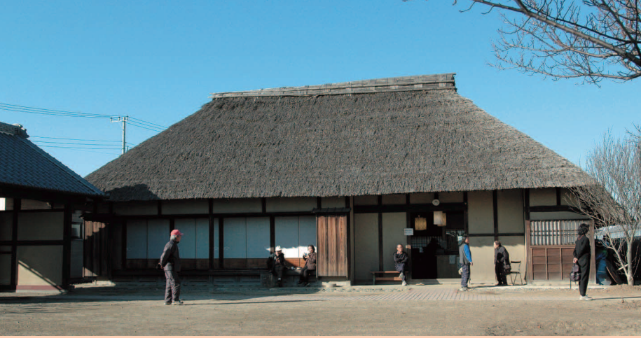
伊佐沼農産物直売所の隣にある食堂「伊佐沼庵」。地元の野菜を使った料理を味わうことができます