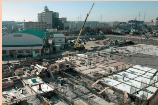
改築中の月越小学校

また、教育環境の充実を図るため、昨年からの改築を進めております月越小学校につきましては、平成十八年度中に完成いたします。