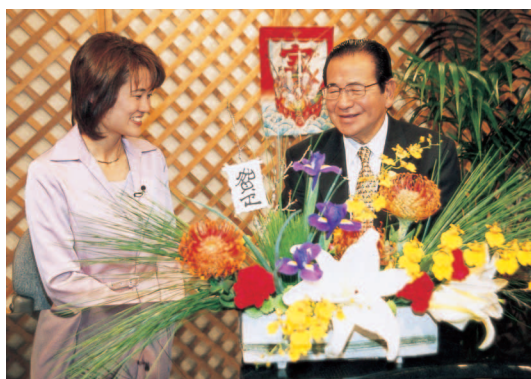
収録の様子 (KCVスタジオ)