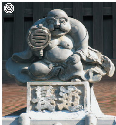
布袋は、一番街に面した1階の屋根の上にあります