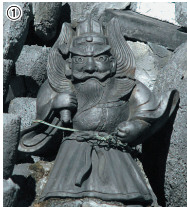
① 2階の屋根の上に乗っている鍾馗。向かって左側の、見つけにくい所がありました

七福神の一人である布袋。市内「七福神めぐり」では見立寺（元町二丁目）にあります。怖い顔をしている鍾馗は、魔よけの神様。通町の山車人形にもなっています。布袋が福をもたらし、鍾馗が魔よけをする。いつまでも、蔵の町並みを守ってくれそうですね。