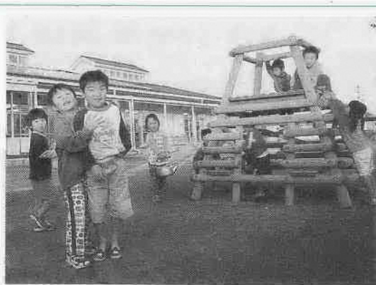
安心して子育てできる環境をつくるための予算も盛り込まれています

3月4日、県立高校合格発表の日は、未明からの大雪に見舞われ、交通機関に影響が出ました。足もとに注意しながら歩く出勤途中で、足早に追い抜いていった3人組の受験生に会いました。その1人が雪で滑り、尻もちをつきながらも雪を払い元気よく高校に向かっていきます。その後ろ姿に「合格しろよ」と心の内で応援。わが家の受験生は大丈夫かな、と心配です▶職場に着くと、開催予定だった広報協力員会議を雪のため急きょ中止するための電話連絡に追われました。雪も小降りになった昼休み、携帯電話に「合格したよ」と妻からの声に思わずニコリ。多くの新社会人・新入生が誕生する4月、皆さんの健闘を期待します▶もうすぐ小江戸川越春まつり、市内各地で催しが行われます。川越再発見の散策をしながら、広報の素材探しをしたいと思います。春の日ざしの中、皆さんも散策などいかがですか。