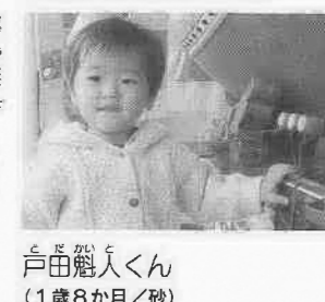
川瀬まつりに参加できるかな