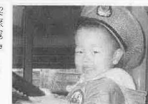
ボクはバスの運転手、出発進行!!