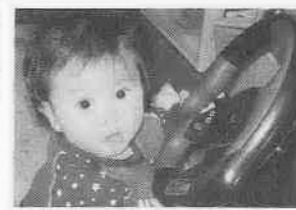
☆ホクの夢はレーサー☆