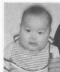
引地七彩ちゃん (4か月/藤間) 将来は、なでしこジャパン!!