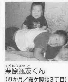
お兄ちゃんたちには負けたくないー