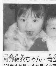
結衣お姉ちゃん、いっしょ♡