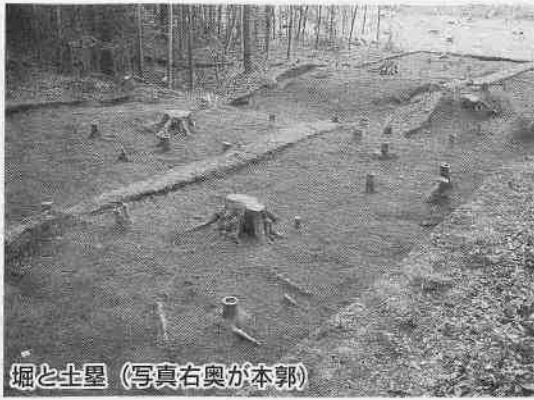
堀と土塁 (写真右奥が本郭)

いちばん内側の堀と土塁から、城が造られた時代を示すと思われる十五世紀後半の土器・陶器が出土しているほか、本郭からは当時の高級品である中国産の茶入れや、土器製のさいころが出土しています。城を築いた武士たちが、茶の湯やすごろくを楽しんでいたのでしょうか。当時の建物跡はまだ見つかっていませんが、焼けた石や壁土が出土するため、城を燃やしたと思われる