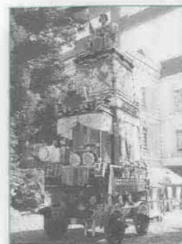
志多町・弁慶の山車