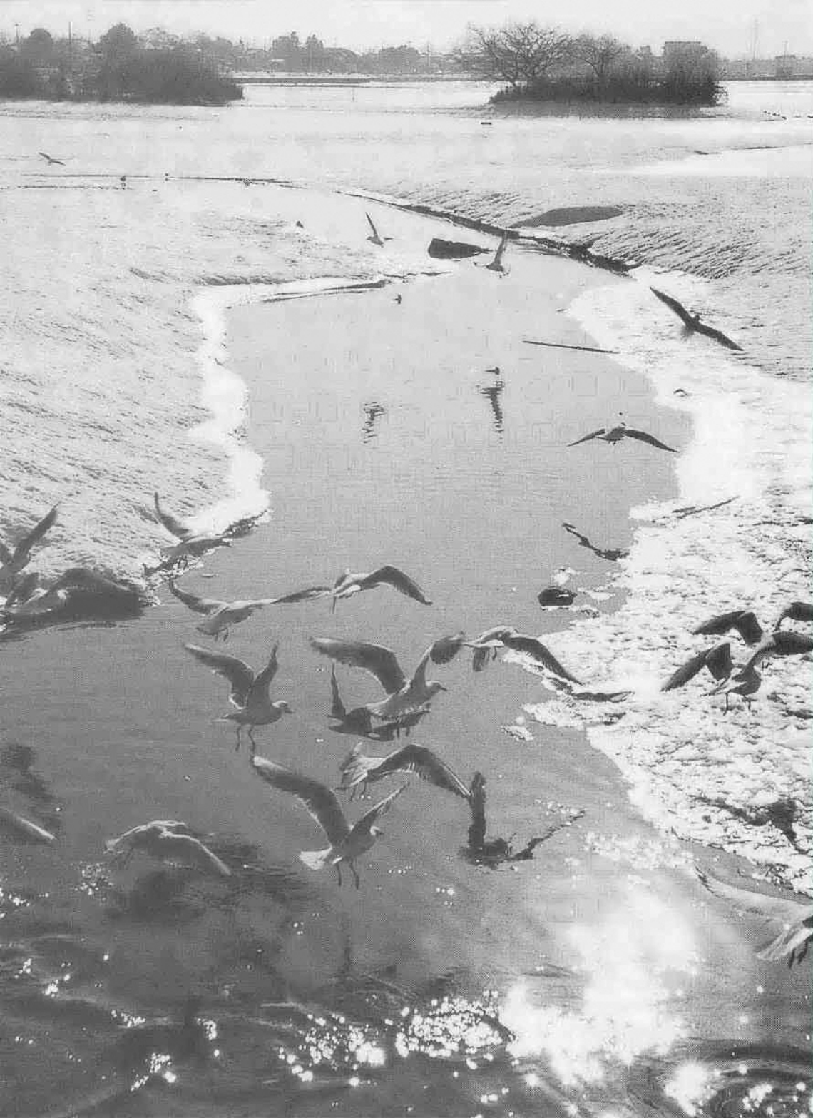
わくわく散歩道シリーズ184 (関連記事は8ページ)