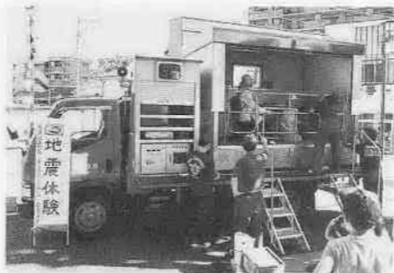
川越地区消防組合に配備されている起震車

消防隊が火災発生現場に急行したくても、家屋の倒壊などで道路が寸断されてしまうと現場へ到着することが困難となり、たとえ到着したとしても水利が使用不能となっているおそれがあります。大切なのは、自分の身を守る行動とともに、火を消す行動です。