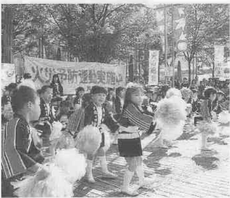
幼年消防クラブによる街頭広報の様子

市内幼稚園・保育園の幼年消防クラブの子どもたちによる演技・演奏。当日直接会場。 日時：11月11日(土)、午前10時～正午 会場：西武本川越へ前 問い合わせ：消防本部予防課 ☎22-0744