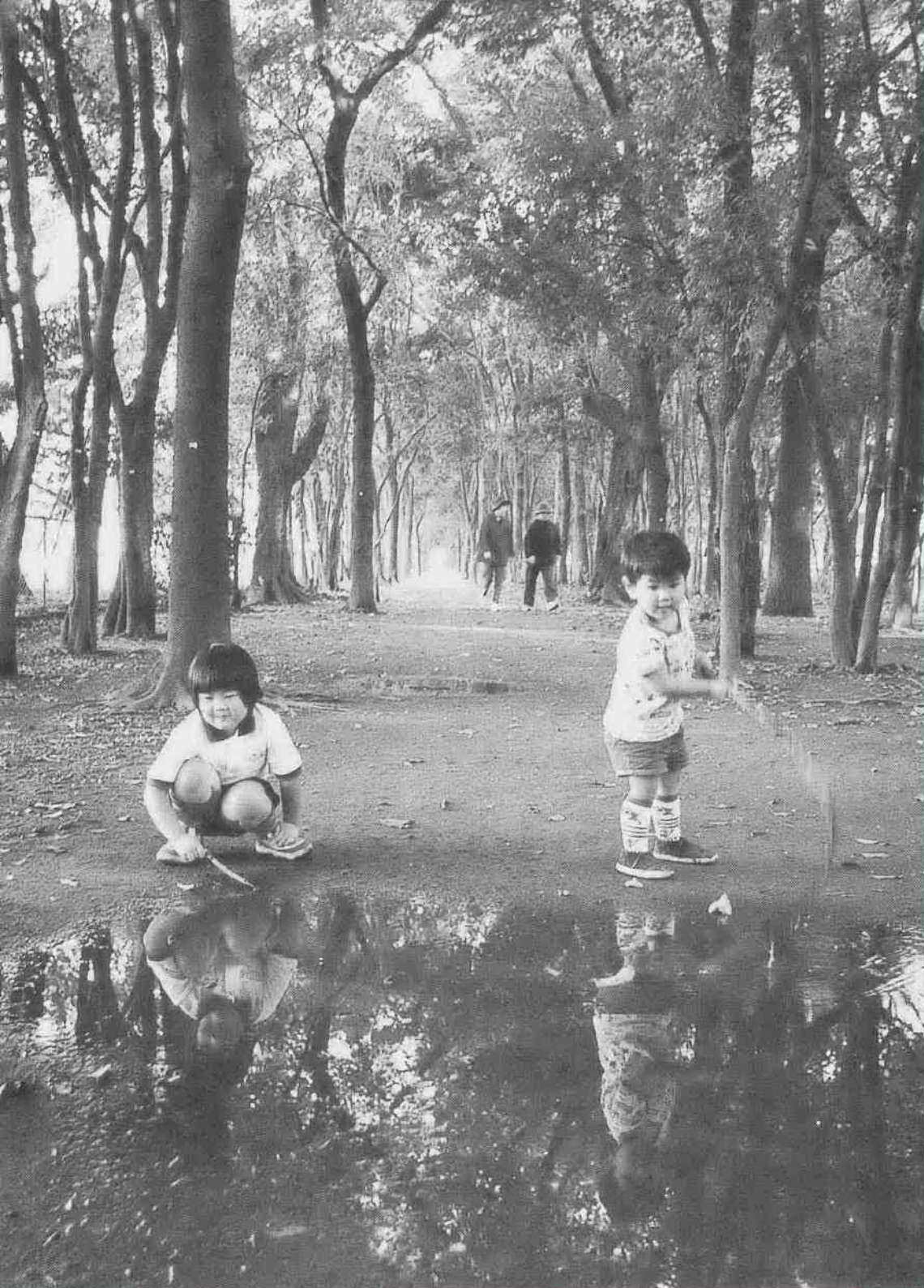
わくわく散歩道シリーズ181 (関連記事は8ページ)