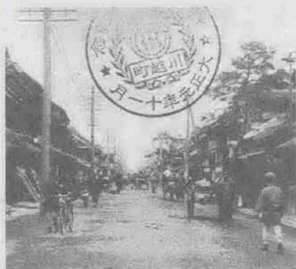
大正元年の南町通り (現在の一番街) ふるさとの思い出 写真集(明治・大正・昭和)川越 岡村一郎編から

明治の川越商人が大火後のまちを創りあげたように、近年、まちづくりに新しい動きが見られます。市内には川越らしさを考えた店舗が目立ってきました。それらは、すでにあるものに敬意を表わし、ま