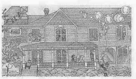
ギルバートハウス子ども博物館のイラスト図

一足早いクリスマスプレゼント。十二月四日(木)、米国・オレゴン州・セーラム市から、おもちゃの贈り物が届きました。ツイスターゲーム、木製汽車セット、ジグソーパズル、ヨーヨー、人形、ぬいぐるみ、絵本、カードゲームなど、いずれも米国の子どもたちが、ふだん遊んでいる品物。日本の子どもたちにも、すぐに受け入れられそうな物ばかりです。早速、市内の子どもたちにおもちゃで遊んで