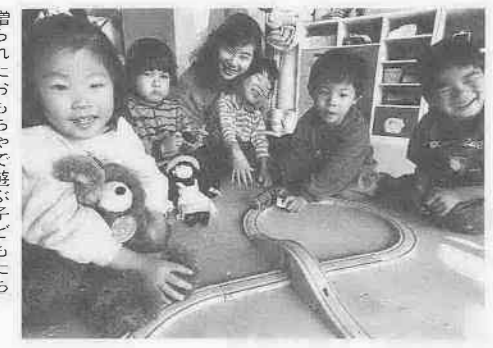
贈られたおもちゃで遊ぶ子どもたち

もらおうと、児童センターこどもの城とひかり児童園にある「おもちゃ図書館」に置かれました。きっかけは、昨年二月、川越市姉妹都市交流委員会からセーラム市にけん玉、ペーゴマ、羽子板、人形など日本の伝統的なおもちゃや、小学校で使っている教科書、ランドセルなどを贈ったことから。それらは、完成したばかりのセーラム市立「ギルバートハウス子ども博物館」で、世界中のおもちゃといっし