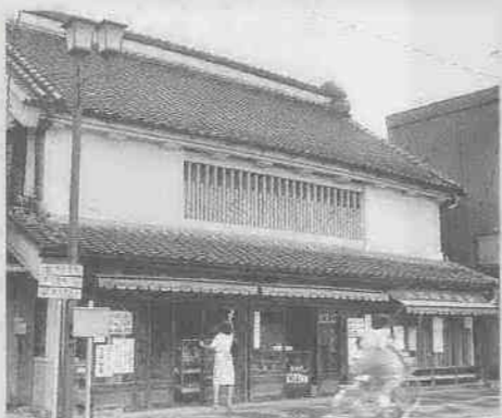
大沢家住宅 (国指定重要文化財) 川越大火前に建築された蔵造り。 築後二百年を経過しています。 ※今回の修復によって建設当時の 黒い壁になります。

まちを愛する人が創るまちは、人の息づかいが感じられるもの。川越を訪れる方たちが求めるものも生活感のある「川越のまち」ではないでしょうか。