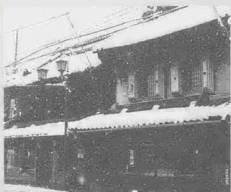
雪景色も温かい 蔵のぬくもりは、雪さえ温かく 感じさせてくれます。

●ご協力ありがとうございます 札の辻~仲町交差点間は、電線地中化工事が行われ、一方通行となっています。このため、工事の行われる日の午前8時30分から午後5時までは、仲町交差点から一番街に進入できません。