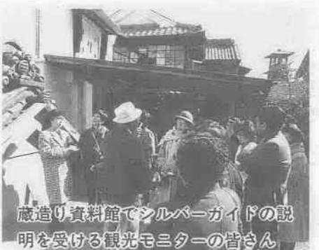
蔵造り資料館でシルバーガイドの説明を受ける観光モニターの皆さん

首都圏の日帰り観光地として脚光を浴びている小江戸川越に、さらに多くの観光客を呼び込もうと、全国でも珍しい「観光モニター」の制度を発足。西武新宿線沿線の都内と県内の美容院百四十五店舗に委嘱しました。店内にポスター