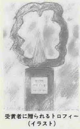
受賞者に贈られるトロフィー（イラスト）

鉄骨造を感じさせない白木生地の伝統的なファサードに墨で書かれた「近瀬」の書体、高低差を取り入れたモダンな店内、表通りから見えない3階部分の処理など、町並みに対する伝統性と店舗作りにも現代性が絶妙なバランスで溶け込んでいます。 ファサード：建物の正面のこと