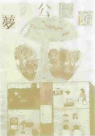
今回の公民館の集いでは、小・中・高校生や、一般の方からお寄せいただいた「夢の公民館」の展示もありました。ここに紹介するのは、その一部。これらを含め、作品は、3月20日(水)まで中央公民館で展示しています。ご覧ください。