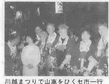
川越まつりで山車をひくセ市一行

・検針票に記載の番号)をお知らせください。 ○中止するまでの期間は、料金がかかりますのでご注意ください。 ※土曜日の午後(午後零時三十分以降)、日曜日、祝祭日、第二・