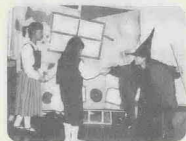
昨年のクリスマス公演から「ヘンゼルとグレーテル」

どう変わったのか尋ねると、「二年以上続けている子はとても積極的になってきて『私が主役をやりますよ』という子も出てきましたよ」。さらに、リーダーシップを取れる子にもなるそうです。「練習中、小さい子が迷っているとき、私がフォローするより先に声をか