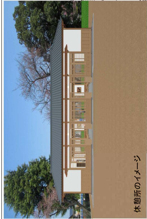
休憩所のイメージ

【本丸御殿前広場】 本丸御殿前の地盤の高さを往時の高さとし、茶系の自然色舗装にすることで土の雰囲気を感じられるようにしました。