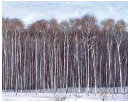
① 自転車のある風景 1973年 ② 白樺の森 1995年 ③ 銭函 1975年 ④ 北海道旅行スケッチ 駒ヶ岳の朝 1951年 ⑤ エトルタ 1979年 ※作品は全て当館蔵