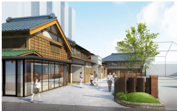
整備後の施設正面イメージ図