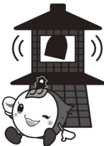
川越市マスコットキャラクター ときも

漬物に係る衛生上の危害の発生を防止するため、その原材料の受入れから製品の販売までの各工程における取扱い等の指針を示したものであり、漬物に関する衛生の確保及び向上を図ることを目的としています。平成24年に発生した浅漬による腸管出血性大腸菌食中毒の発生を受け、平成25年12月13日に改正されました。