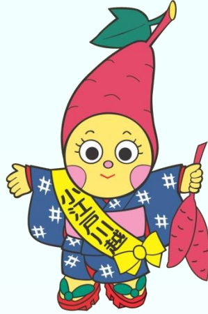
小江戸川越紅ちゃん (さつまいも伝来 400 年記念シンボルキャラクター)