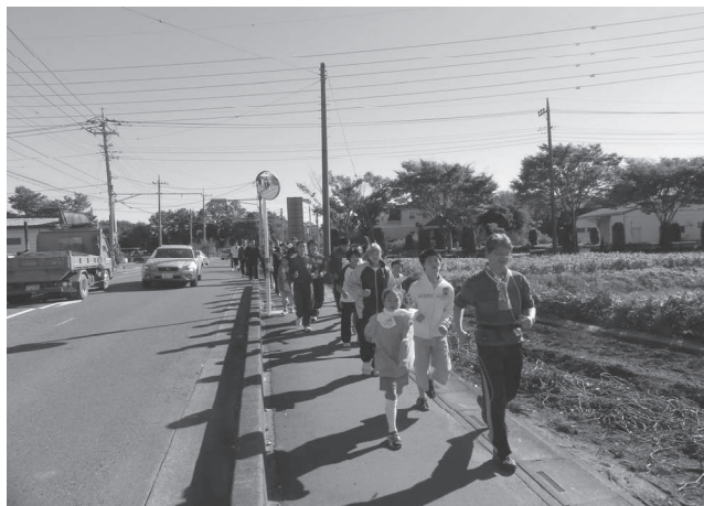
家族や仲間とともに、笑顔でウォーキング

そこで、市民（外国人を含む）の誰もが、いつでも、どこでもスポーツに親しみ、生涯にわたって心身ともに健康で、ゆとりと潤いのある豊かな生活を実現していくために、スポーツ環境を整え、市民一人ひとりが日常生活の中にスポーツを取り入れることのできる生涯スポーツ社会の実現に向けて、「第二次川越市生涯スポーツ振興計画」を策定します。