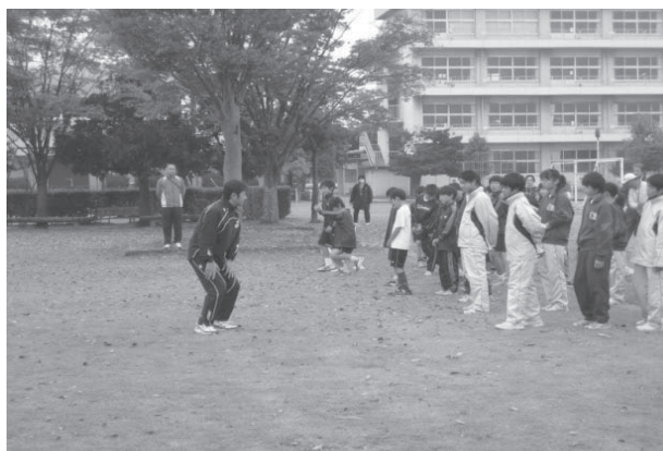
芳野スポーツクラブ