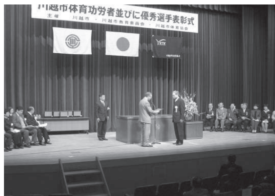
体育功労者・優秀選手表彰式