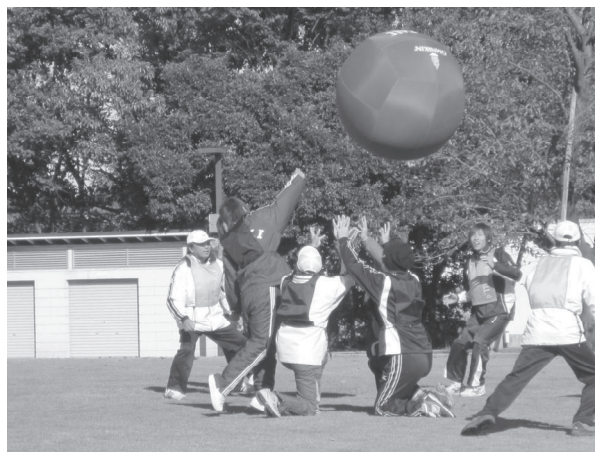
生涯スポーツフェスティバル