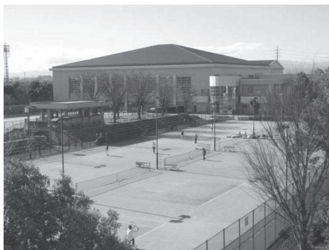
川越運動公園 総合体育館・テニスコート