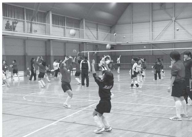
トップアスリートによる中学生バレーボール教室