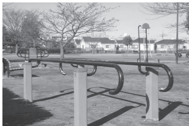
岸町健康ふれあい広場