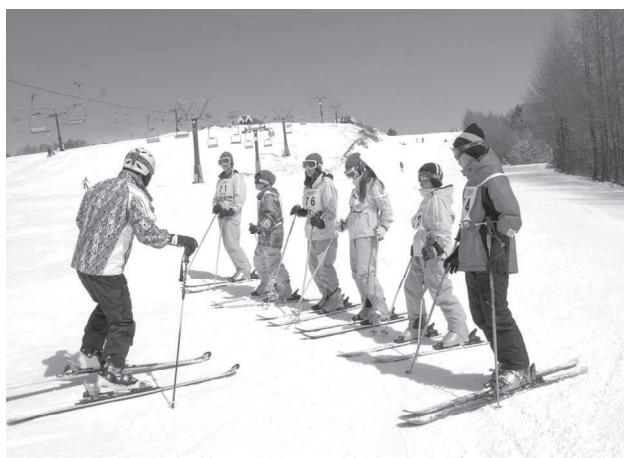
ジュニアスキー教室