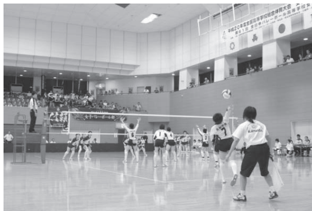
平成20年度 全国高等学校総合体育大会 (バレーボール会場…川越運動公園総合体育館)