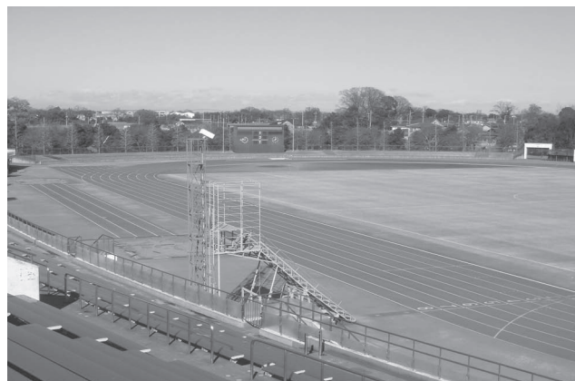
川越運動公園 陸上競技場