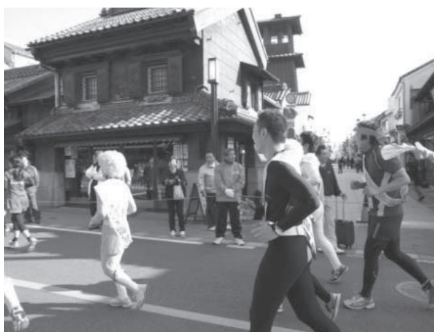
小江戸川越マラソン