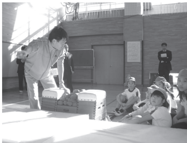
学校における体育授業（小学校）