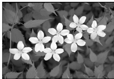
市の花「山吹」 Flower representing Kawagoe City: Japanese Rose