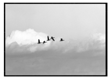
市の鳥「雁」 Bird representing Kawagoe City: Wild Goose