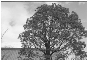
市の木「かし」 Tree representing Kawagoe City: Oak